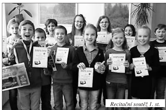
Recitační soutěž 1. st.