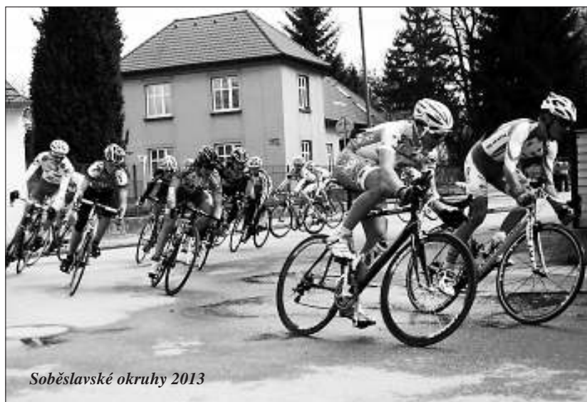
Soběslavské okruhy 2013

Memoriál Jana Huška se opět jede jako silniční kritérium. Jde o třetí závod Českého poháru v letošní cyklistické sezoně. Dá se předpokládat velká účast ve všech kategoriích a možná i kvalitní obsazení zvuchými jmény. Podrobnosti na str. sportu.