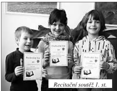
Recitační soutěž 1. st.

Dne 27. února se konalo školní kolo recitační soutěže žáků 2. stupně.