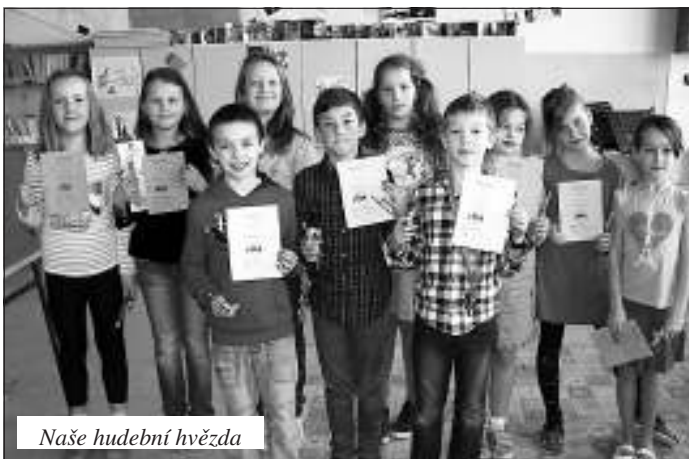
Naše hudební hvězda