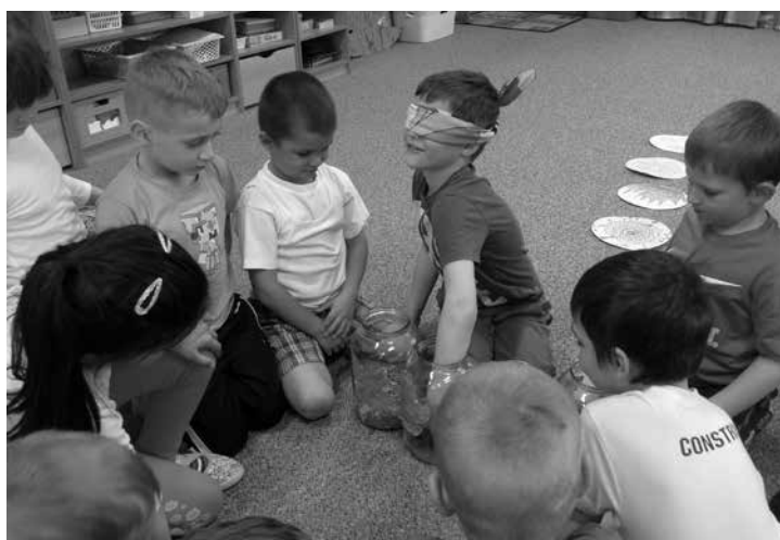
Kolektiv MŠ DUHA

Začátkem května proběhly v naší mateřské škole zápisy a ukázalo se, že naše město je oblíbeným místem i pro mladé lidi, kteří se sem stěhují z celé republiky.