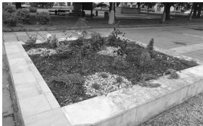
Od května kráší soběslavské náměstí nová květinová výzdoba