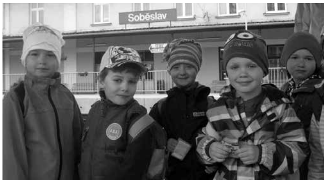
Kolektiv MŠ Nerudova