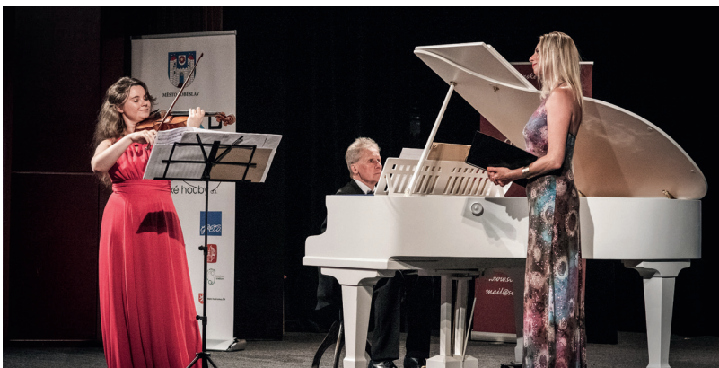
ÚT 5. 7.: Chvála houslí, kulturní dům