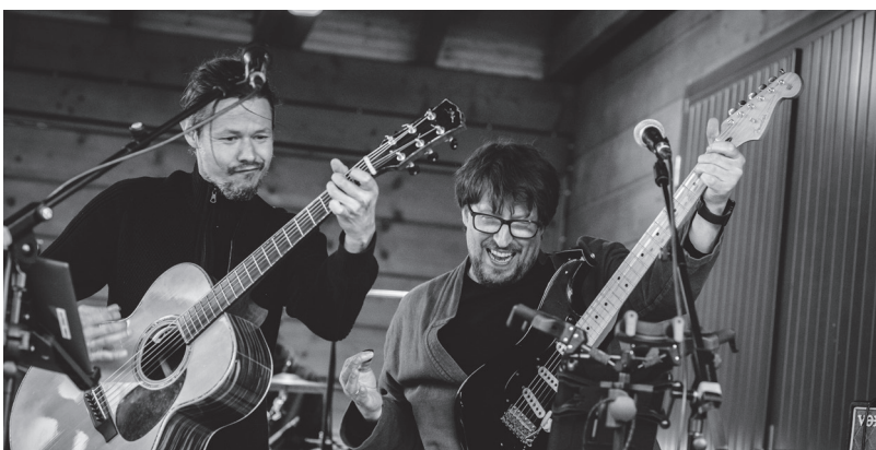
PÁ 8. 7.: Open-air koncert na koupališti Domáci výroba aneb Pecky všechny