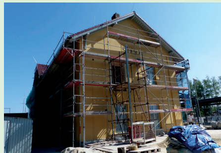
Rekonstrukce výpravní budovy pokračuje.

běhlá turistická sezóna a plné obsazení ubytovny. Práce budou dokončeny v září.