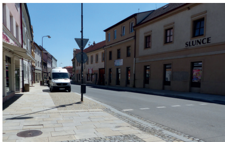
Rekonstrukce chodníků v ulici Petra Voka byla dokončena s výjimkou instalace veřejného osvětlení. V současnosti nejsou na trhu dostupné potřebné sloupy.

Rada města souhlasí s uzavřením dodatku č. 1 ke smlouvě o dílo mezi městem Soběslav a firmou Spilka a Říha, s. r. o., Soběslav, na akci „Stavební úpravy ulice Petra Voka v Soběslavi“, kterým se snižuje konečná cena díla o 15.942 Kč na částku 3.185.820 Kč + DPH a posunuje termín dokončení díla do 31. 8. 2022.