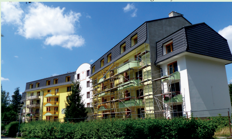
Stavební práce na nástavbě senior-domu se chýlí ke konci.