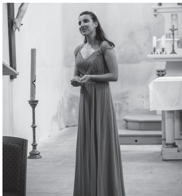
NE 10. 7.: První koncert účastníků kurzů, kostel sv. Víta