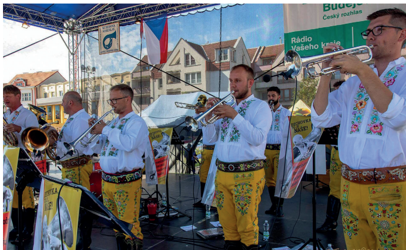
V neděli od 16:30 zahrála bohatě krojovaná Tůfaranka.