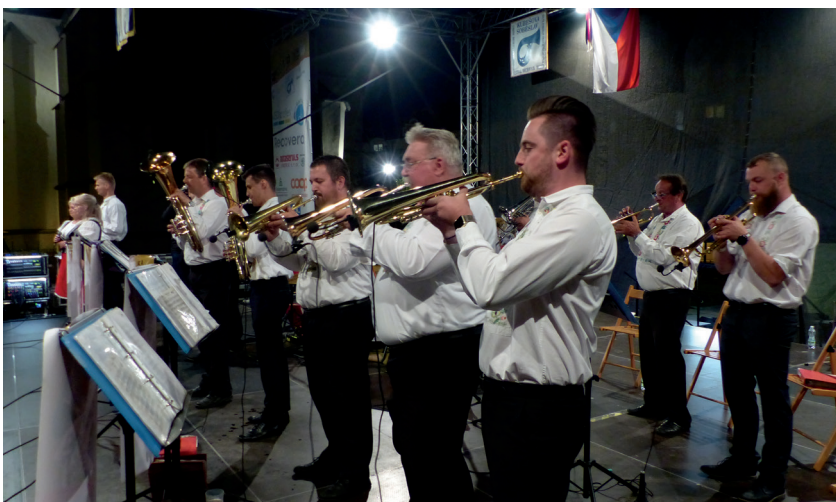
Lácaranka letos zahrála v sobotu ve 22:30 h.