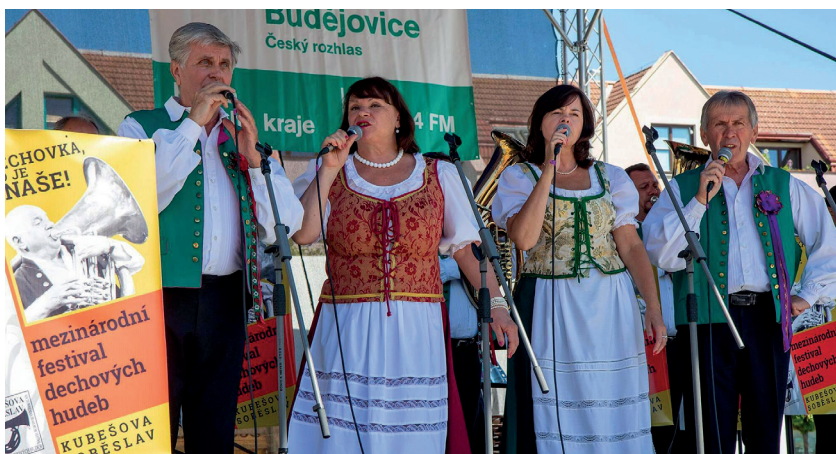
Nahoře: Koncert kapely Krajanka byl vysílán do Českého rozhlasu ČB. Dole: Festivalová nálada, počasí letos festivalu přálo. Oba dva dny bylo slunečno.