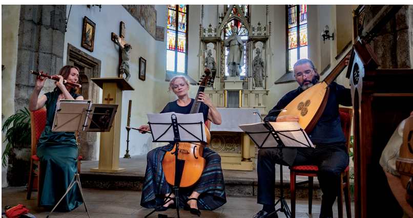
NE 3. 7.: Collegium Marianum: Hudba pro Krále Slunce, kostel sv. Víta