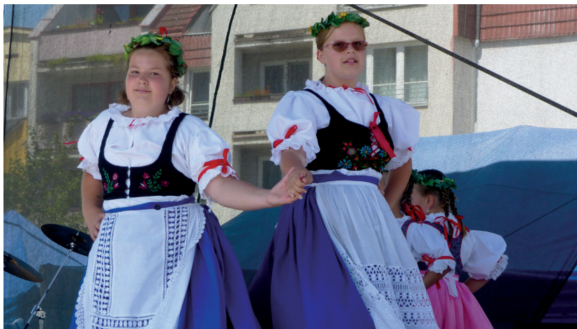
V sobotu na pódiu zatančil dětský folklorní soubor Ráček.

Počasí se vydařilo. Slunce se na letošní festival usmívalo a bylo teplo, ale nesužovaly jej příliš vysoké teploty, bouřky, silný vítr nebo dešť. Dechovku si přišlo i v dnešní složité době poslechnout 1482 lidí. V pořadí 27. ročník festivalu je tak za námi a na dalším se opět potkáme 15. a 16. července 2023.