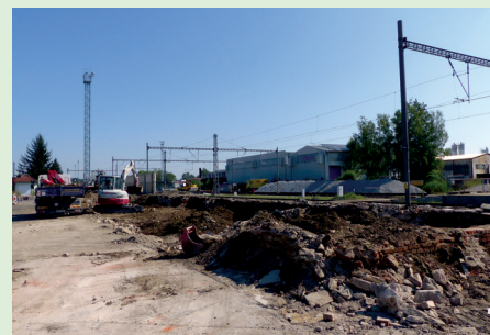
V ulici Riegrova byl zbourán sklad.